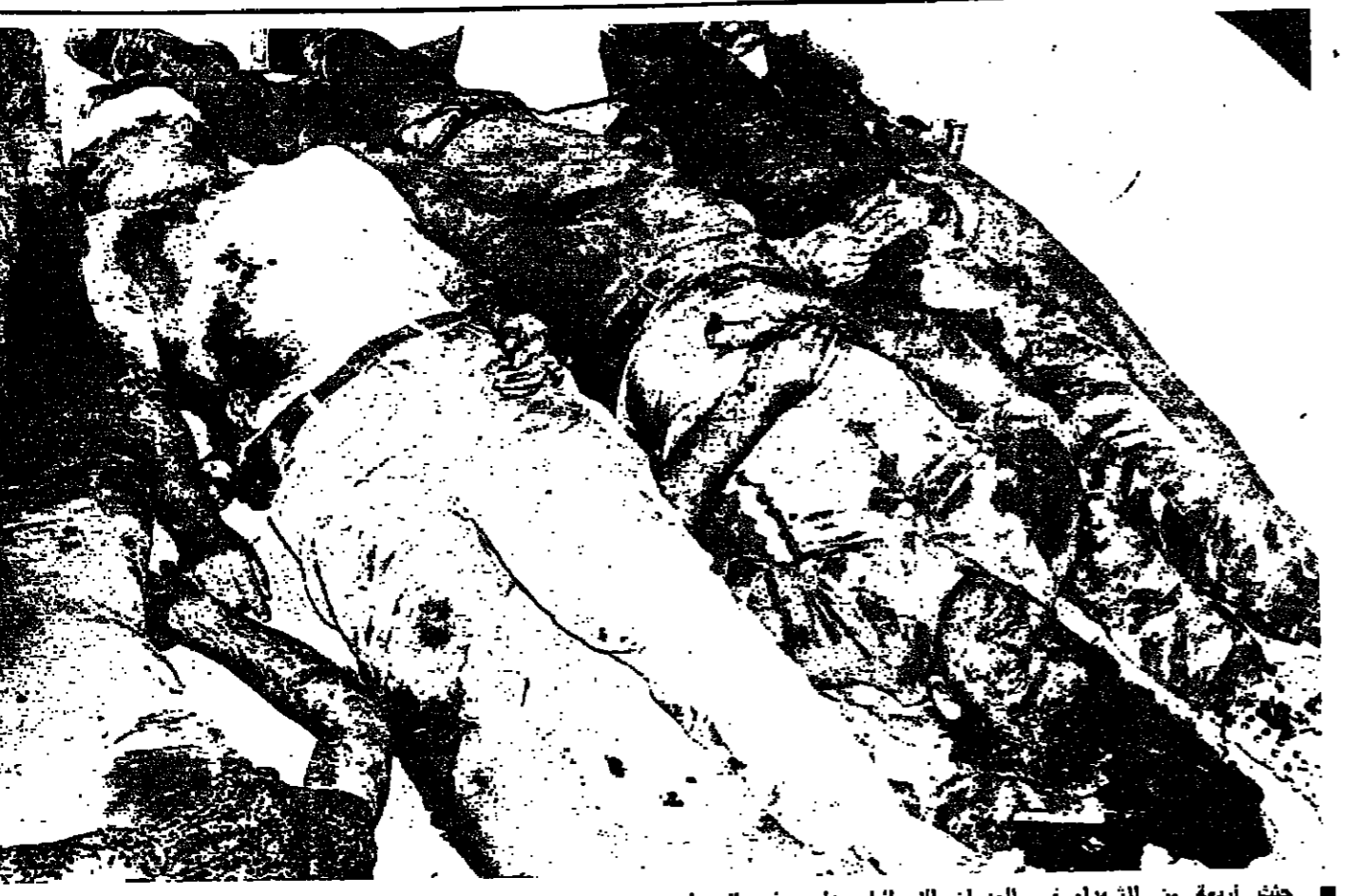
جثث أربعة من الشهداء في العدوان الإسرائيلي على مخيم البص امس